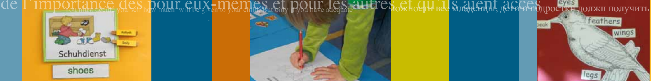
Layout und Gestaltung: kwh-design

obcego od podstaw. W takiej sytuacji, różnice w stopniu znajomości języka niemieckiego nie mają tak dużego znaczenia, jak podczas nauczania niemieckojęzycznego. Można nawet pokusić się o stwierdzenie, iż dzieci niemieckojęzyczne mają mniej doświadczenia w nauce języków obcych, niż ich rówieśnicy z rodzin osiedleńskich, których członkowie rozmawiają między sobą w języku ojczystym-różnym od niemieckiego. Nie należy także obawiać się „przeciążenia nauką” dzieci, poprzez ich edukację w języku obcym lub kolejnym języku obcym, jak w przypadku uczniów, dla których język niemiecki nie jest językiem ojczystym. Przeciwnie, nauka nowego języka poprawia kognitywny (poznawczy) rozwój ucznia, jak i poszerza horyzonty jego rozumowania.