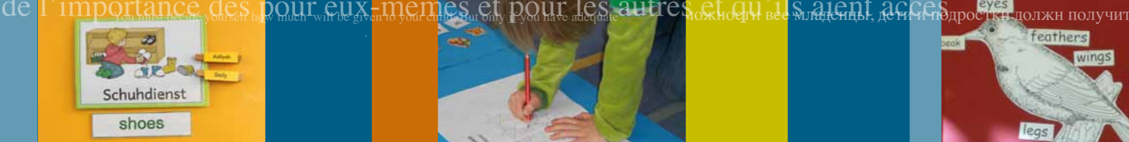
Layout und Gestaltung: kwh-design

nicht mehr im Vordergrund. Kinder, deren Familiensprache nicht Deutsch ist, sind sogar im Vorteil, denn sie haben schon Erfahrung damit, eine andere Sprache zu lernen. Eine Überforderung durch Unterricht in einer zweiten oder – für Kinder mit einer anderen Familiensprache als Deutsch – dritten Sprache ist nicht zu erwarten. Im Gegenteil, das Lernen einer neuen Sprache fördert die kognitive Entwicklung, die Denkfähigkeit, insgesamt.